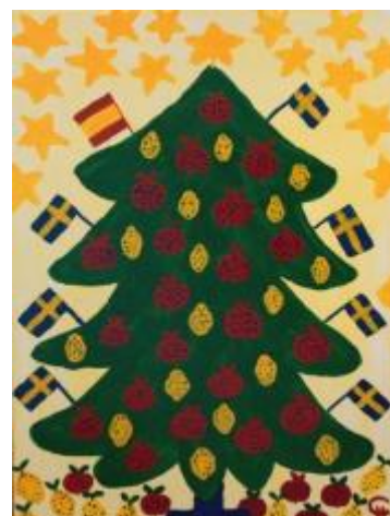
Målning av Caj Holm

Julbord i kyrkan onsdagen den 21 december klockan 18.00. För anmälan gå in på www.svenskakyrkan.se/mallorca och sök på julbord där anmälan kommer att finnas inom kort.